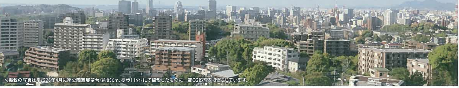
※掲載の写真は平成26年4月に南公園西展望台(約850m、徒歩11分)にて撮影したものに一部CG処理をほどこしています。

平成26年5月10日午前10時より、大和ハウス工業株式会社 福岡支社リビングサロンにて、先着順申込受付開始となります。 ※お申込の際には、申込金10万円、平成25年分の所得証明書、本人確認資料(運転免許証など)、認印をご持参下さい。